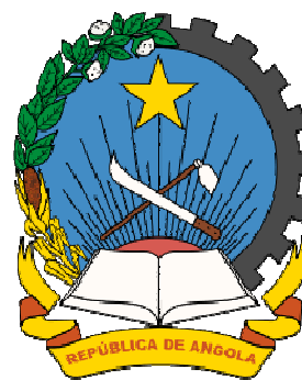
Obrázek 2: Angolský znak