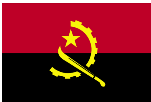
Obrázek 1: Angolská vlajka

Státní hymna se jmenuje Angola Avante (Kupředu, Angolo) a je oficiálně používána od roku vyhlášení nezávislosti – 1975. Angolská měna se nazývá kwanza ( Angolan Kwanza , AOA), která se dále dělí na 100 lwei. V současné době (únor 2012) se směňuje 100 AOA za přibližně 20,13 českých korun (PENÍZE, 2012).