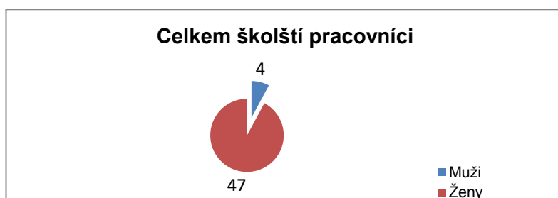
Graf 1: Struktura respondentů

Graf demonstruje složení respondentů. Ve skupině výrazně převažovaly ženy. Muži byli zastoupeni pouze 8%. Tento výsledek můžeme zevšeobecnit jako údaj, který svědčí o celkovém stavu rozložení poměru mužů a žen v našem školství, které je výrazně feminizováno.