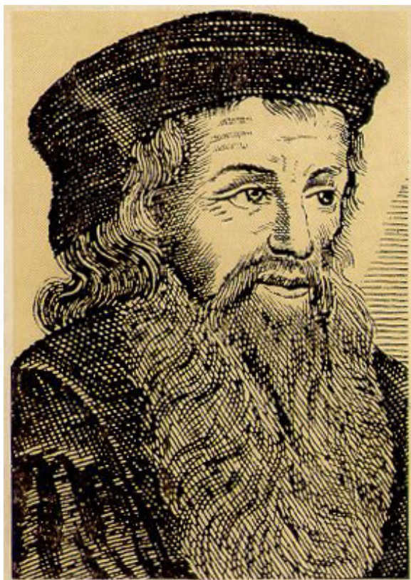
obrázek č. 4

„Všechno záleží na tom, klademe-li pravdu na první místo nebo na druhé.“