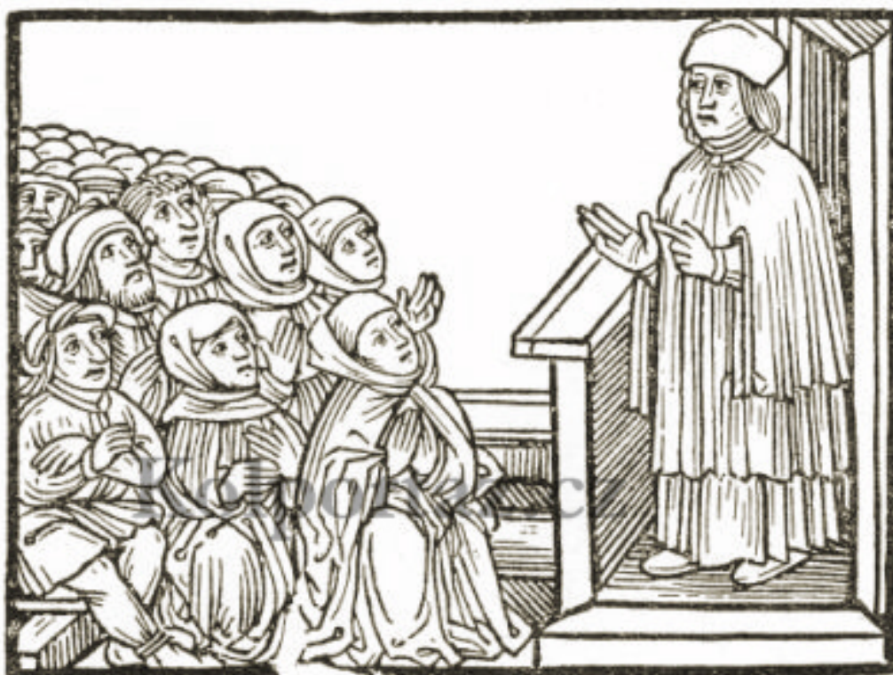
obrázek č. 3

V letech 1402–1403 se tedy Husova kariéra začíná slibně rozvíjet. Současně se však polarizují stanoviska. Důležitou roli nejen v Husově životním příběhu, ale i v dějinách české církevní reformy, má anglický reformátor John Viklef 1330–1384. V zápase o Viklefa se nakonec ukázal nejen rozpor, ale i jádro problému.