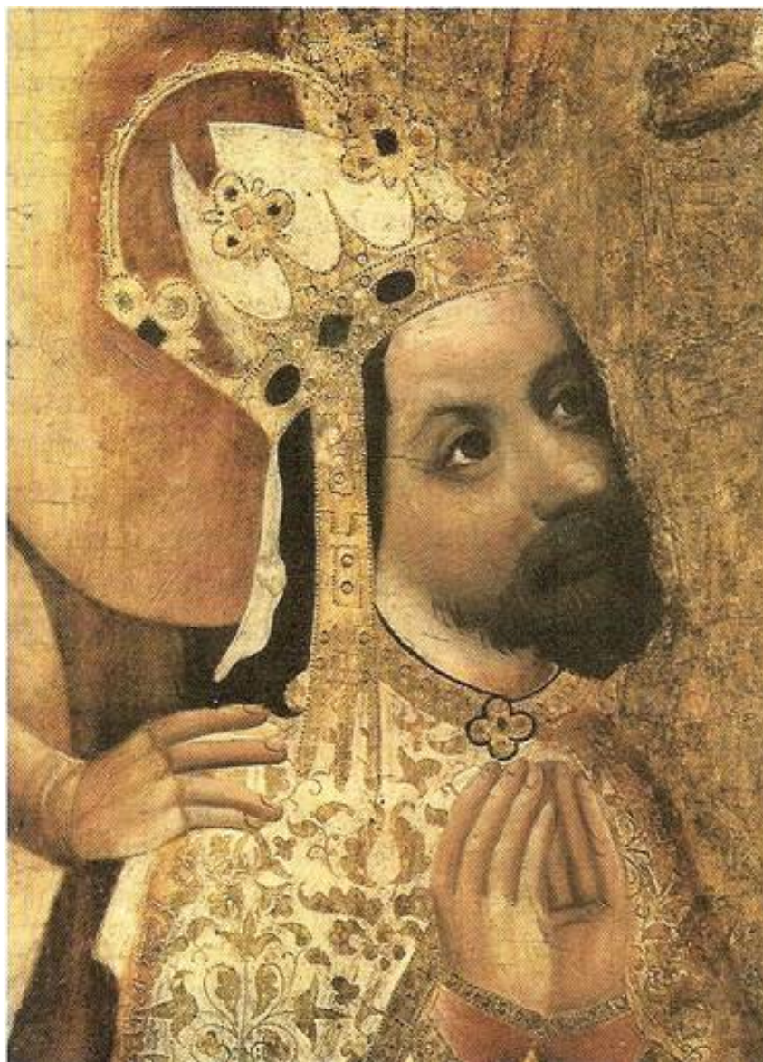
obrázek č. 5

Velmi důležité je Husovo kázání k univerzitě, které přednesl jako její rektor u příležitosti výročí úmrtí Karla IV. v roce 1409. I když tato slavnostní řeč je v duchu dobových projevů spíše sbírkou citátů, Hus dává vřele najevo svůj vztah k zakladateli univerzity i k vědcům, kteří ji pomáhali budovat.