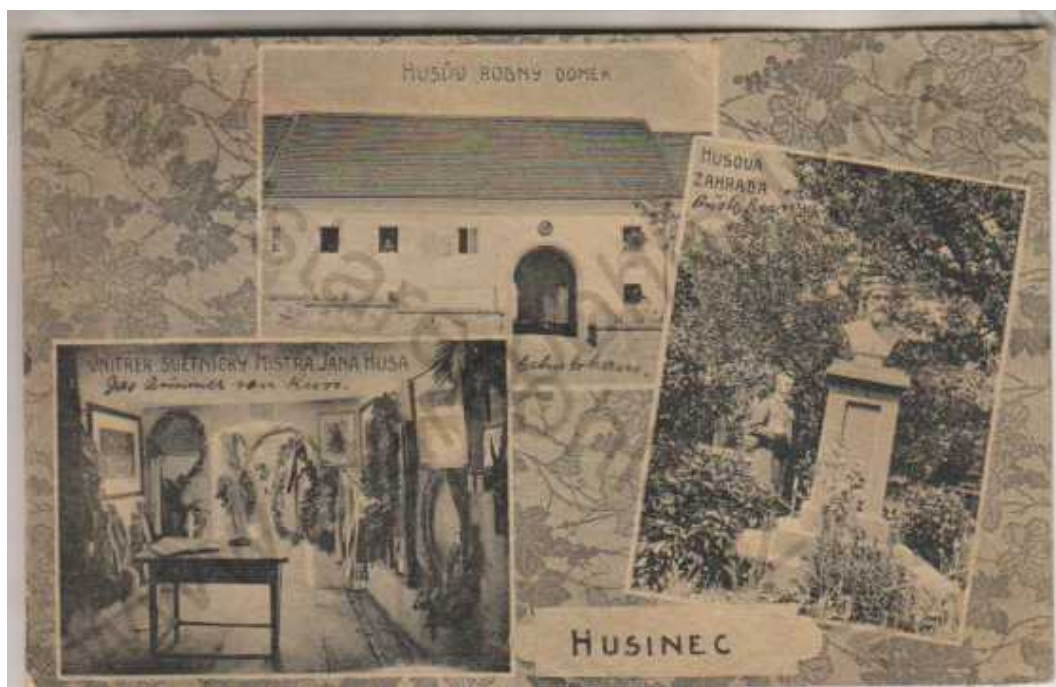
obrázek č. 1.

Husinec pravděpodobně vznikl po roce 1340, první zmínky o něm pocházejí z roku 1359. Procházela tudy Zlatá stezka, která vedla z Bavor přes Prachatice, a obec patřila k panství hradu Hus. Koncem 14. století byl Husinec rozdělen mezi dvě vrchnosti, v 16. století náležel již celý k vimperskému panství. Tehdy se stal městysem a po zrušení roboty, kdy zde vzniklo několik továrniček, patřil vedle Vimperku a Lenory ke třem nejprůmyslovějším městům prachatické oblasti. Místo, kde stál Husův rodný domek zachovala tradice patrně věrně. K roku 1879 se uvádí, že ještě v polovině 17. stol.: „...chodívali lidé k dřevěnému domku Husovu a řezávali z něho kousky dříví jako památný ostatek a pověrečný prostředek proti bolení zubů.“