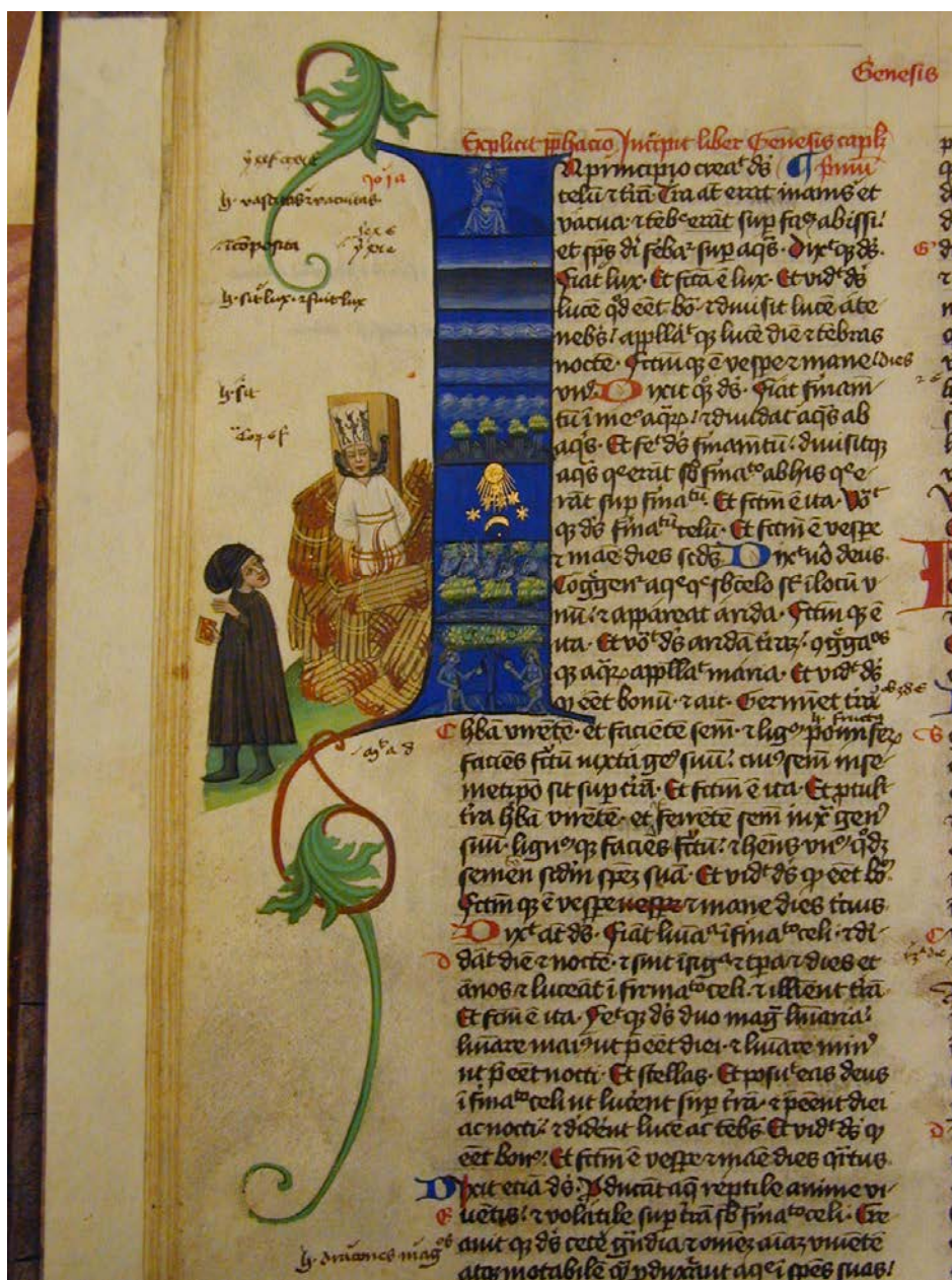
obrázek č. 6

Hus neustoupil ze svých názorů a byl 6. července 1415 upálen na hranici před hradbami Kostnice. Husův popel byl vysypán do Rýna, aby z něj nic nezůstalo jeho věrným. Paradoxně Husova smrt kazatelovo učení ještě více popularizovala a vyvolala v českých zemích lidové bouře.