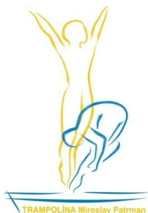
Obrázek 3: Logo oddílu