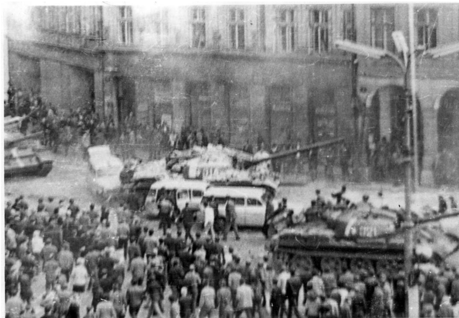
Příloha 2 – Tank 314 couvá a poškozuje zaparkované sanitky.