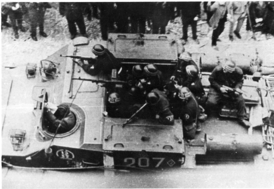
Příloha 3 – Projíždějící vojáci.