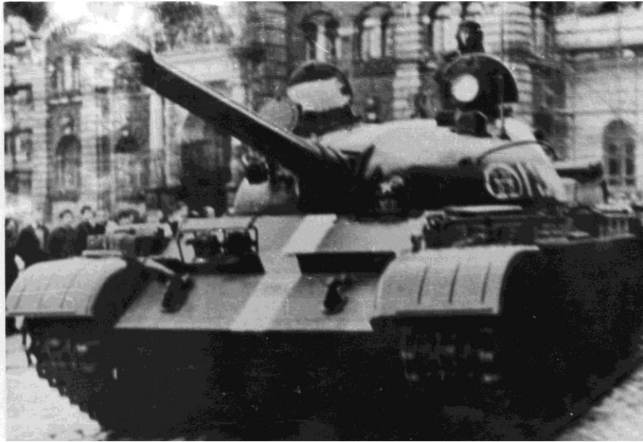
Příloha 5 – Tank před libereckou radnicí.