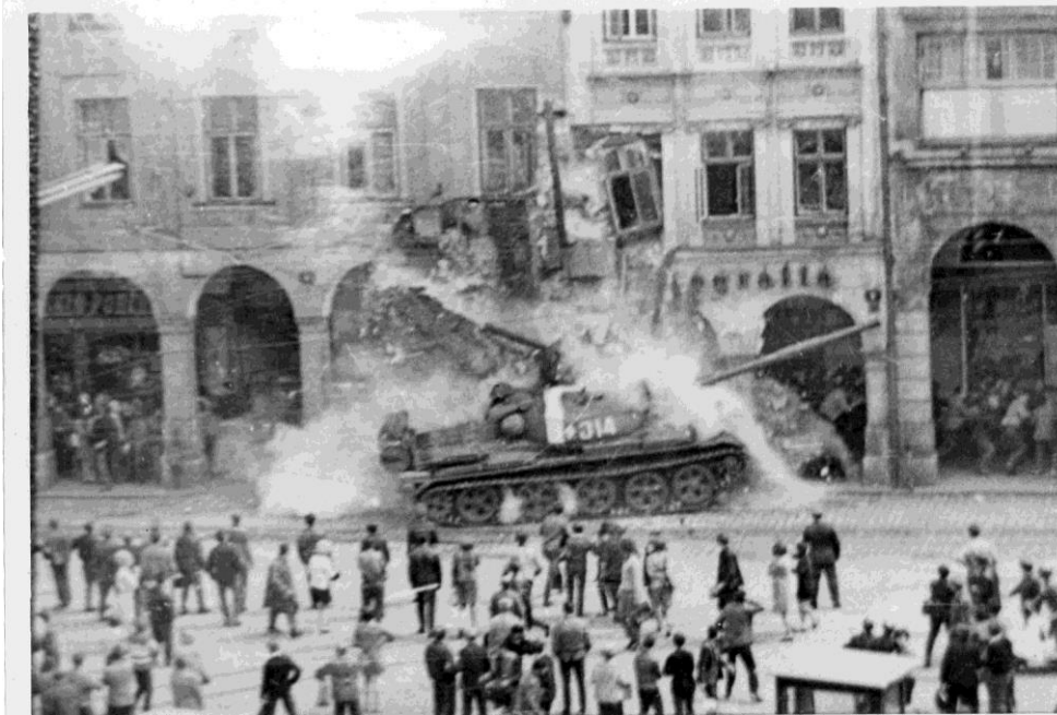
Příloha 1- Proslulý tank 314 vjíždí do budovy Fotografia, padající suť z domu nachází své první oběti.