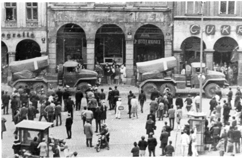
Příloha 6 – Kolona projíždějící přes náměstí Bojovníků za mír (dnes Dr. E. Beneše).