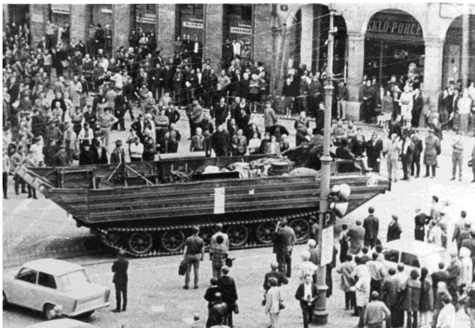
Příloha 4 – Shluk lidí na libereckém náměstí Bojovníků za mír (dnes Dr. E. Beneše).