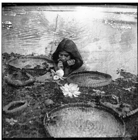
3. V Paraguayi, během následujících cest 109