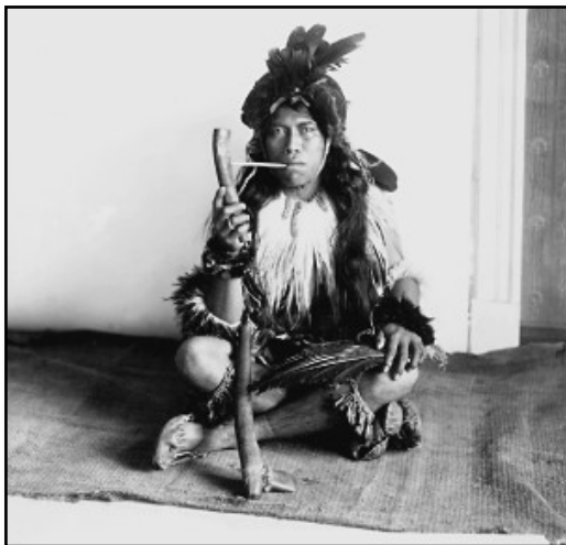
6. Čerwuiš po příjezdu do Čech 112