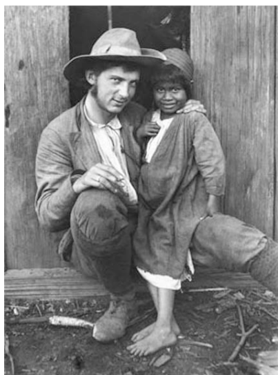
2. U Indiánů kmene Čamakoko 108