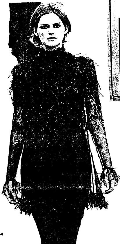
Nová romantika období 98 v průsvitnosti a luxusní výšivce v prostotě střihu je znakem vysoké třídy.

Nikde se neučil kreslit a přesto je každá jeho kresba mistrovská. Namísto pastelek používá dekorativní kosmetiku značky Shu Uemura, na které oceňuje nejširší barevnou paletu.