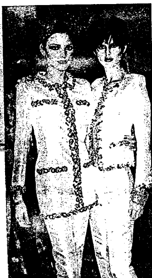
Téma Chanel v Lagerfeldově verzi z konce 80. let.