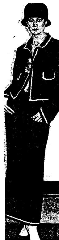
V roce 1999 dává Lagerfeld kostýmu Chanel nové proporce i tkaniny.