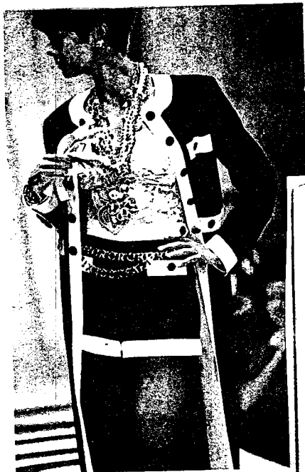
Téma Chanel v Lagerfeldově verzi konce 80. let...