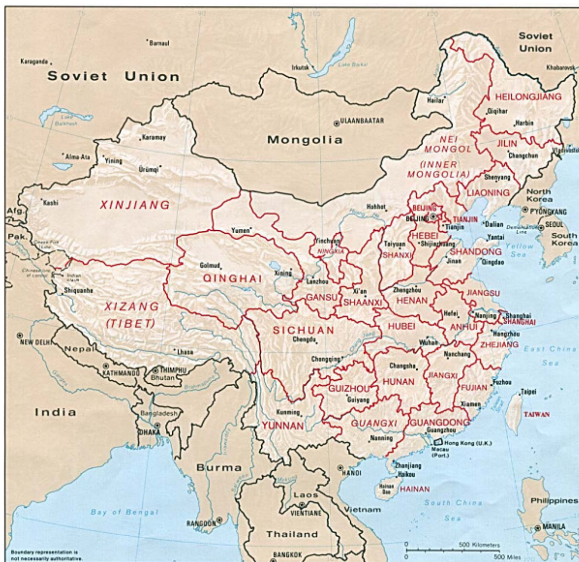
Obrázek 2 – Administrativní dělení Číny