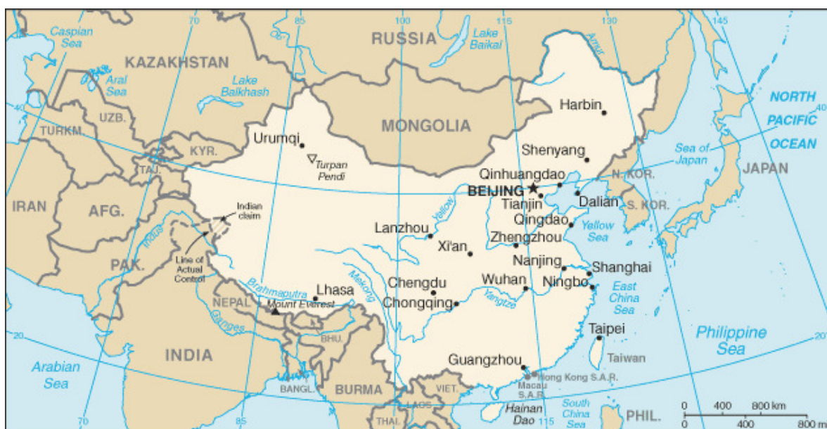
Obrázek 1 – Mapa Číny