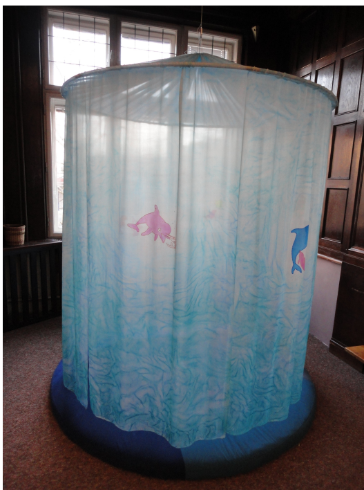
Obrázek č. 1 – delfíní kokon