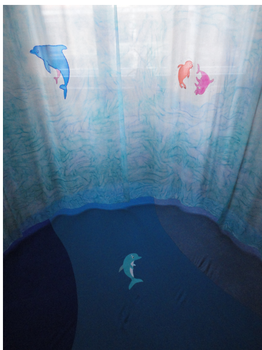
Obrázek č. 2 – delfíní kokon