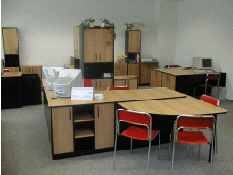
Obrázek 3: Učebna fiktivních firem na OA Most (foto 2)