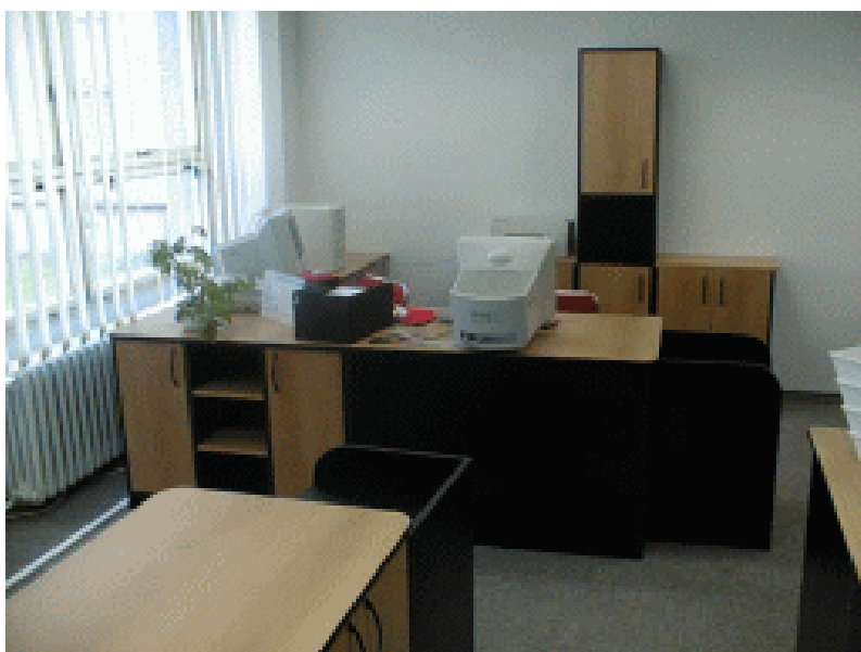
Obrázek 2: Učebna fiktivních firem na OA Most (foto 1)

při získávání pocitu odpovědnosti za vlastní práci. Na Obchodní akademii v Mostě jsou Fiktivní firmy povinným předmětem pro 3. a 4. ročníky. Na začátku 3. ročníku přebírají studenti fiktivní firmu od studentů, kteří ukončili studium v loňském roce, nebo si zakládají firmu vlastní. Firma je ekonomicky aktivní jeden hospodářský rok, tedy od ledna do prosince. Na konci hospodářského roku jsou již studenti ve 4. ročníku. Vypracují ve své firmě účetní závěrku, daňové přiznání a nachystají firmu tak, aby v následujícím roce mohla být případně firma převzata dalšími studenty třetího ročníku.