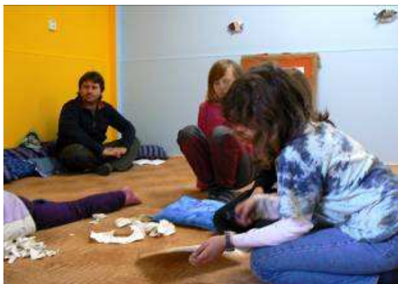
Obrázek 5 Ztvárnění vlastních představ a pocitů po zjištění, že nám někdo lhal.