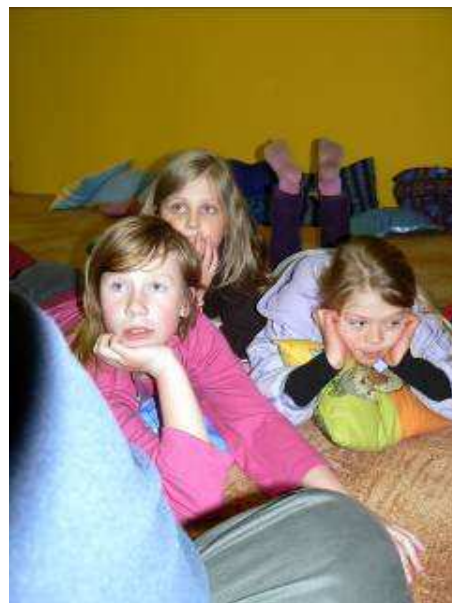
Obrázek 14 Představení dívky