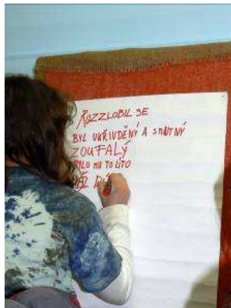
Obrázek 12 Porovnávání pocitů jednotlivých skupin