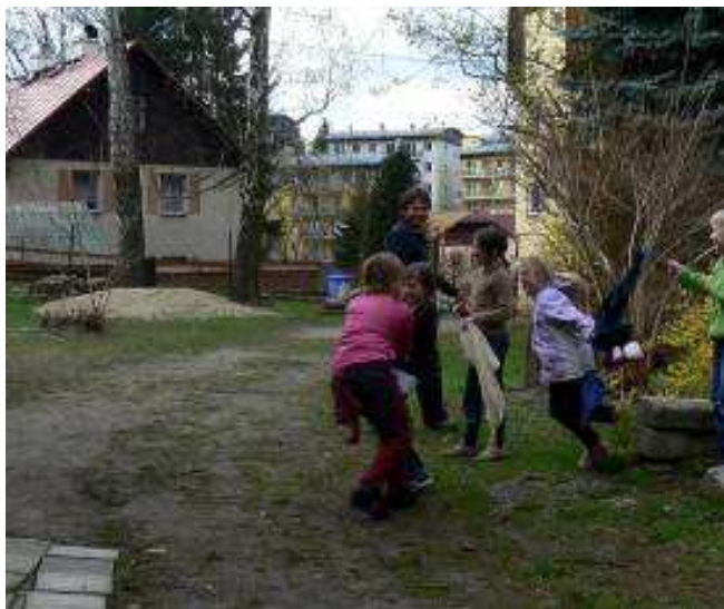
Obrázek 1 Pohybová aktivita „Dračí ocásky“

Příloha obsahuje fotodokumentaci skutečného průběhu jednotlivých setkání.