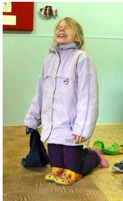
Obrázek 2 Pohybové ztvárnění představ-lež má krátké nohy