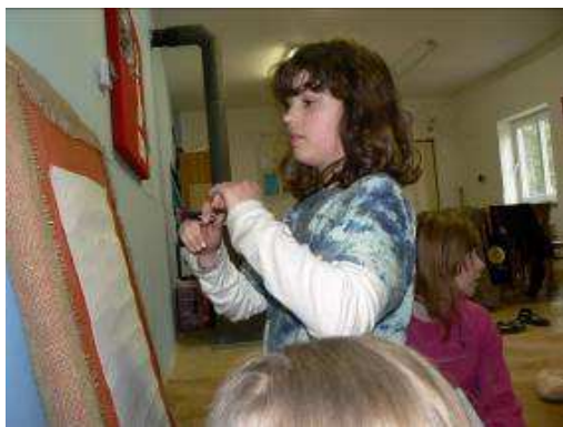
Obrázek 11 Porovnávání pocitů jednotlivých skupin