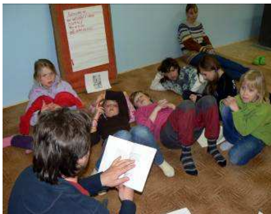
Obrázek 16 Čtení z deníku Lucky