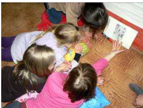
Obrázek 13 Práce s fotografií