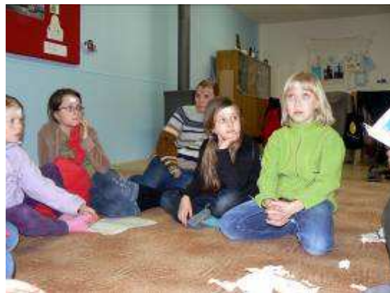
Obrázek 19 Čtení příběhu