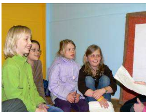
Obrázek 9 Pojmenování pocitů, které ztvárnila pomocí papíru.