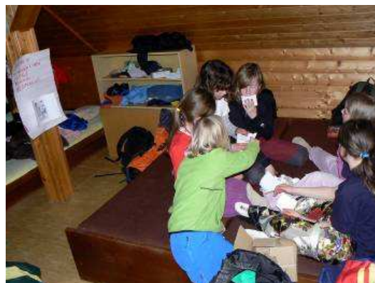
Obrázek 22 Výsledky tajného hlasování