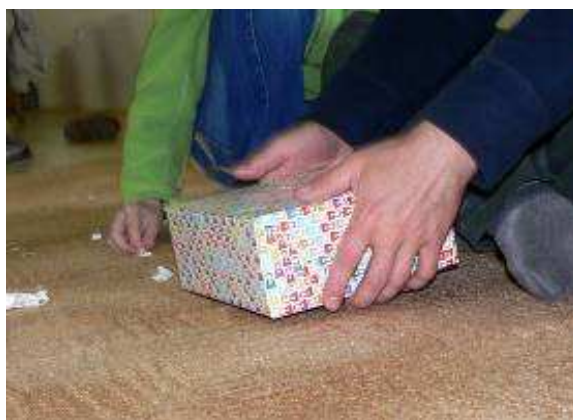
Obrázek 20 Tajné hlasování