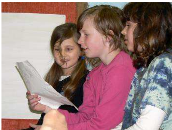
Obrázek 7 Pojmenování pocitů, které ztvárnila pomocí papíru.