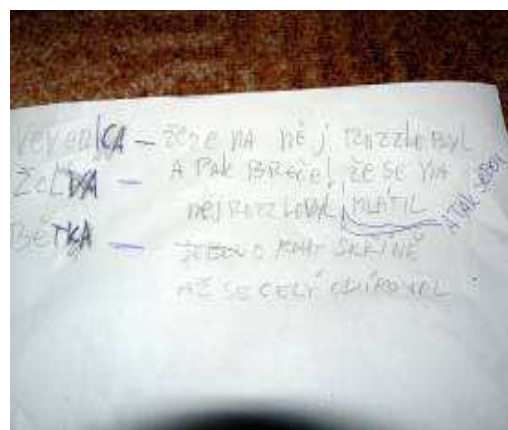
Obrázek 8 Pojmenování pocitů, které ztvárnila pomocí papíru.