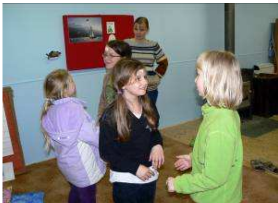
Obrázek 18 Hledání stejného zvířete do páru