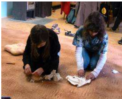
Obrázek 3 Ztvárnění vlastních představ a pocitů po zjištění, že nám někdo lhal.