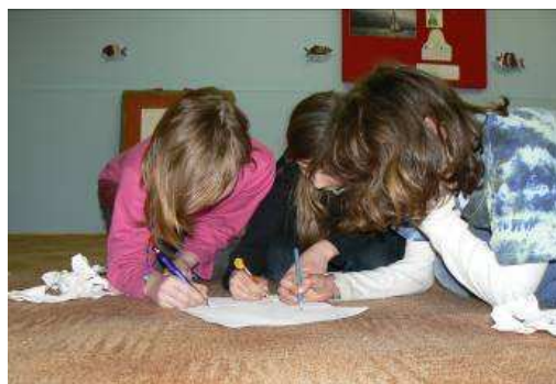
Obrázek 6 Pojmenování pocitů, které ztvárnila pomocí papíru.