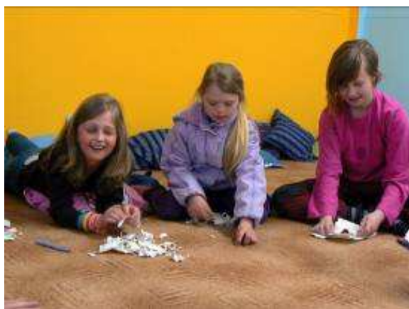
Obrázek 4 Ztvárnění vlastních představ a pocitů po zjištění, že nám někdo lhal.