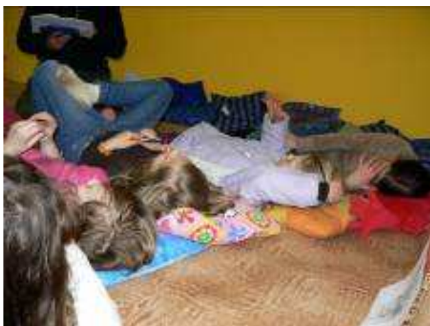
Obrázek 15 Čtení z deníku Lucky