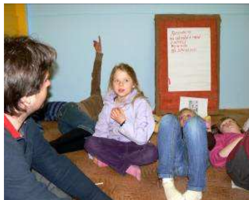
Obrázek 17 Rekapitulace toho co jsme na schůzce dělali