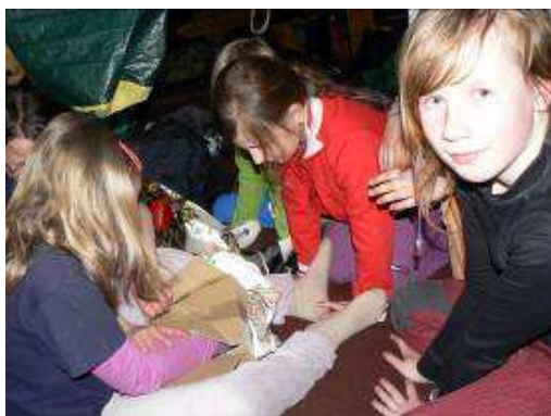
Obrázek 21 Rozdělování hlasovací urny