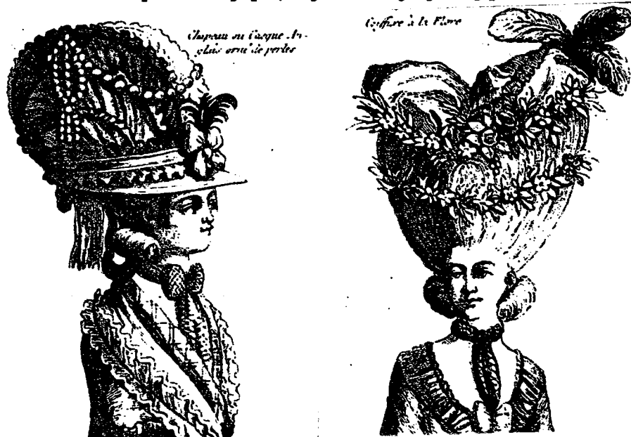
Některé z rokokových vznešených účesů

Obvykle se vlasy vyčesávaly nahoru přes vycpávku z koňských žíní, umístěnou na temeni hlavy, jejíž jediným účelem bylo zvýšit účes. Kadeřníci vždy trávili celé hodiny úpravou jediné hlavy. Jejich honoráře dosahovaly takové výše, že ani bohaté dámy nemohly užívat služeb těchto mistrů častěji než jednou týdně. Oblíbený dvorní kadeřník pracoval před velkými plesy po několik dní. Jeho vznešené zákaznice se nemohly někdy i dvě noci před dvorním balem pořádně vyspat, aby nezničily výtvořiny jeho umění na svých hlavách.