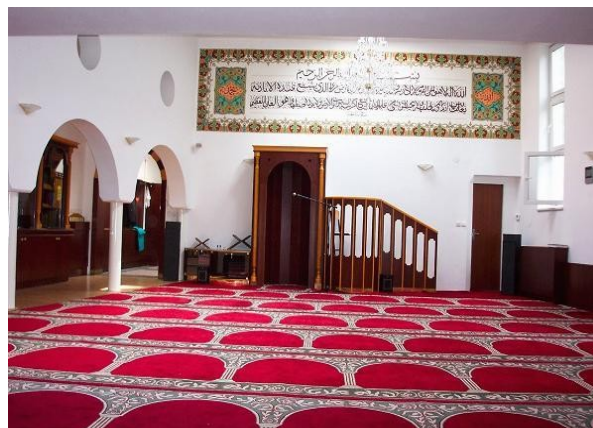
Ilustrace 9: Mešita v Brně - modlitebna

vedlo islám jako své náboženství zhruba 3 600 lidí 68 (avšak toto číslo vůbec nemusí odpovídat realitě, neboť údaj o náboženství je nepovinný), registrace byla téměř nemožná. Situace se zlepšila v roce 2002, kdy