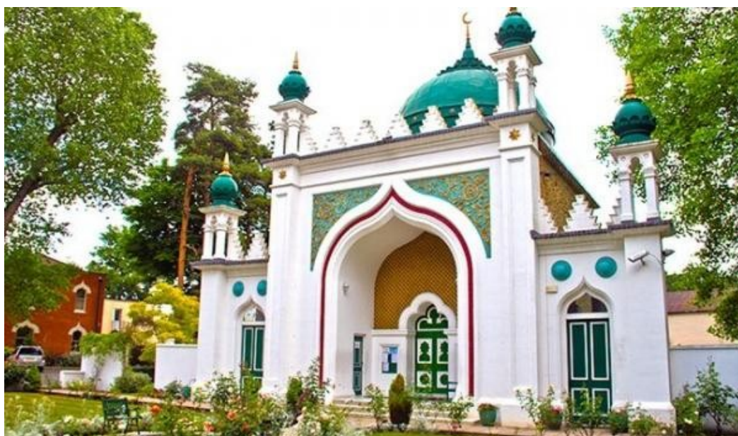
Ilustrace 7: Mešita Shan Jahan