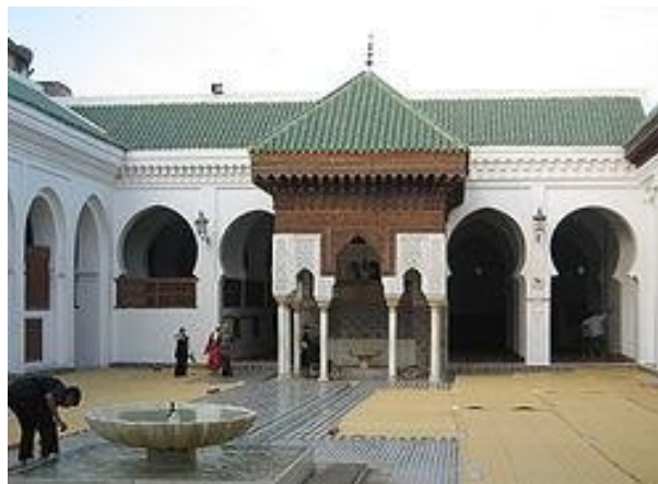
Ilustrace 2: Univerzita Al-Karaouine

Skvělým příkladem muslimky, jež se nesmazatelně zapsala do historie, je Fatima al-Fihri . Tato žena, která se s celou svou rodinou přestěhovala z Tunisu do Maroka, založila světově první univerzitu (viz Ilustrace 2), která garantovala absolventům akademický titul. Stalo se tak již roku 859, poté, co Fatima zdědila poměrně značné jmění svého otce, ta univerzita