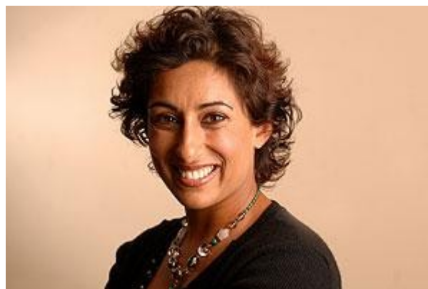
Ilustrace 10: Saira Khan

Jako první jsem vybrala Sairu Khan (viz Ilustrace 10), která se narodila v roce 1970 ve Velké Británii. Tato žena je zdrojem inspirace pro mnoho lidí, ať už jsou dívkami nebo chlapci, muslimkami, matkami, podnikateli či bojovníky za svobodu.