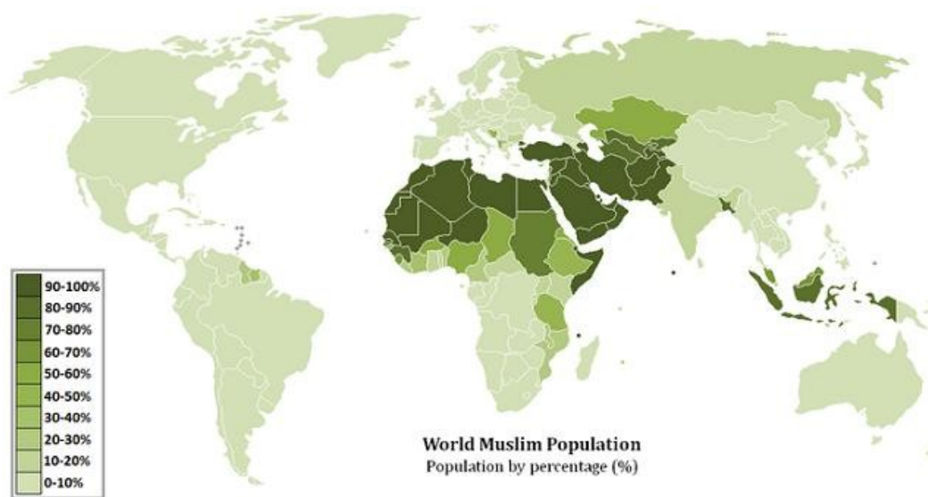
Ilustrace 1: Rozložení muslimů ve světě v roce 2009

Islám je po křesťanství druhé největší a zároveň nejrychleji se rozšiřující náboženství na světě. Již nyní na Zemi žije přibližně jeden a půl miliardy muslimů 4 a toto číslo neustále roste. Převážná část z nich žije na Blízkém východě nebo v severních částech Afriky (viz Ilustrace 1).