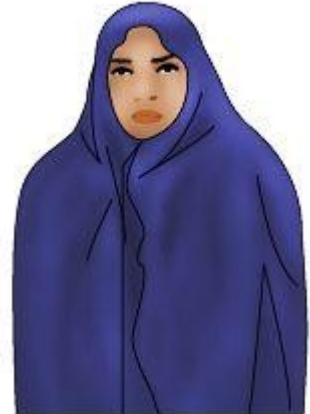
Ilustrace 4: Čadór