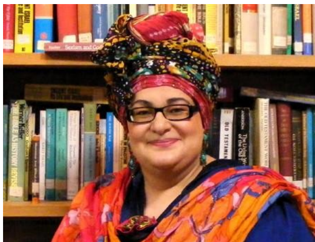
Ilustrace 11: Camila Batmanghelidjh

a protože přišla na svět brzy, trpí těžkou dyslexií, takže téměř neumí číst nebo psát, jak ale sama říká, dnes má šest sekretárek a je jí jedno, že neumí hláskovat. 79 Její otec byl kontroverzní Íránský doktor z bohaté rodiny, její matka je Belgičanka římskokatolického vyznání.