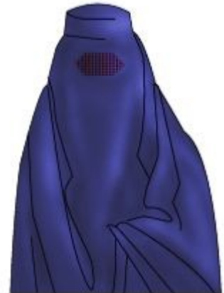
Ilustrace 6: Burka