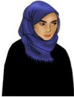
Ilustrace 3: Hidžáb