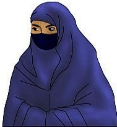
Ilustrace 5: Nikáb