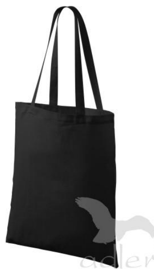
Obr. č. 8 černá taška – DTPSHOP.cz [22]