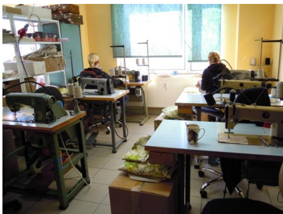
Obr. č. 2 prostory textilní dílny v Teplé [3]