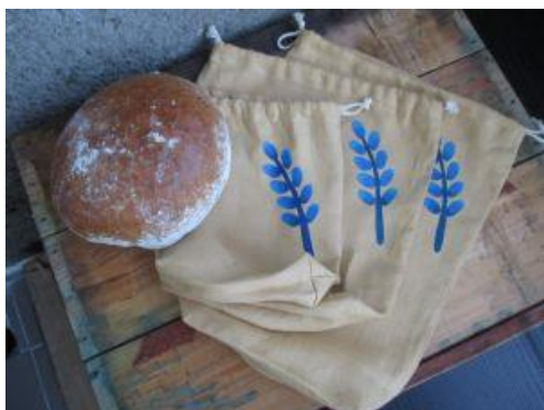
Obr. č. 3 zboží šicí dílny – pytlík [4]

Dílna se zaměřuje na ruční textilní výrobu z přírodních materiálů, jako jsou len, bavlna a jejich směsi, v minimálním množství i jiné materiály. Pracují také s netkanými textiliemi a síťovinami. Základem jsou pytlíky na pečivo a zeleninu, tašky jednoduchých střihů, zástěry a dětské zástěrky. Šičky jsou schopny také vyrobit pestrobarevné závěsné dětské kapsáře, kuchyňské chňapky, utěrky a ubrusy šité na míru. [1]