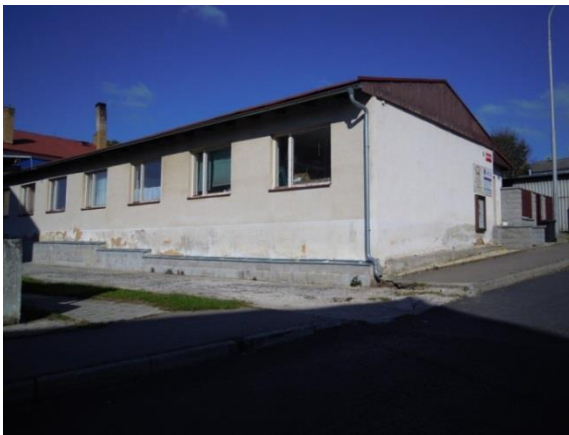
Obr. č. 1 budova textilní dílny v Teplé [2]

Budova, ve které dílna momentálně sídlí, sloužila jako prostor pro šicí provozovny, které byly zrušeny. Nyní si dílna budovu pronajímá od soukromého vlastníka.