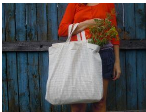
Obr. č. 4 zboží šicí dílny – taška [5]