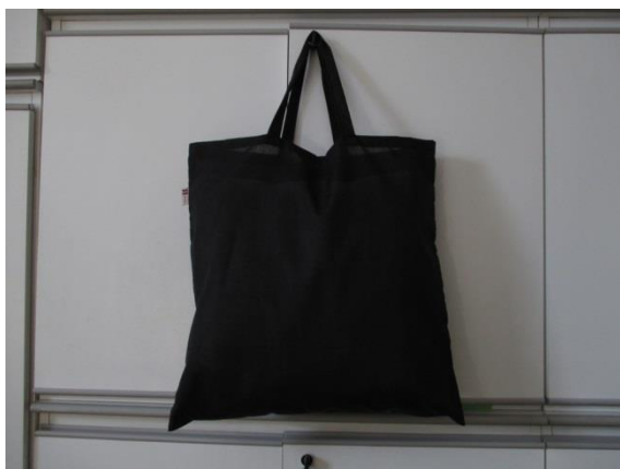
Obr. č. 7 černá taška – Český západ [21]

Joker o. s. Cheb a Ravin, s.r.o. nemají na svých webových stránkách žádné údaje o cenách za zboží, které nabízí svým zákazníkům. V tomto směru má Český západ jednoznačně navrch. Na rozdíl od Ravinu, s.r.o. je Český západ i občanské sdružení Joker Cheb aktivní na sociální síti Facebook, kde propaguje svou činnost, což je v této moderní době velmi populární. Textilní dílna Český západ za černou bavlněnou tašku (viz obr. 7) účtuje 20,- Kč za kus, za podobnou tašku (viz obr. 8) účtuje DTPSHOP.cz 31,30 Kč, z čehož jasně vyplývá, že Český západ o.p.s. výrazně konkuruje této společnosti.