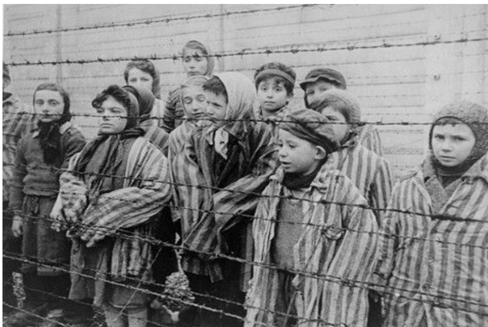
Obr. 2 Fotografie dětských vězňů po osvobození Osvětimi.