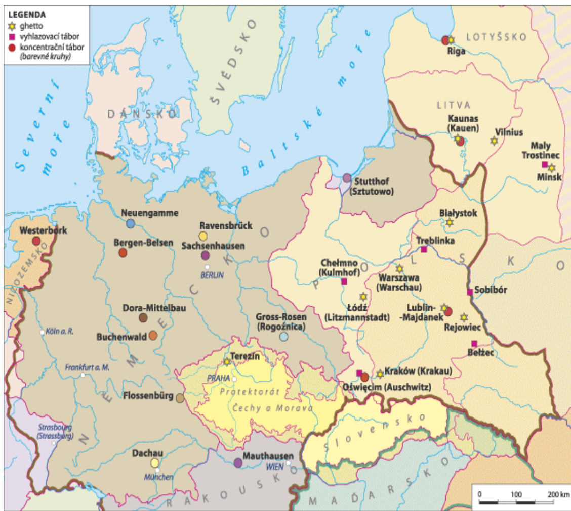
Obr. 3 Mapa koncentračních táborů