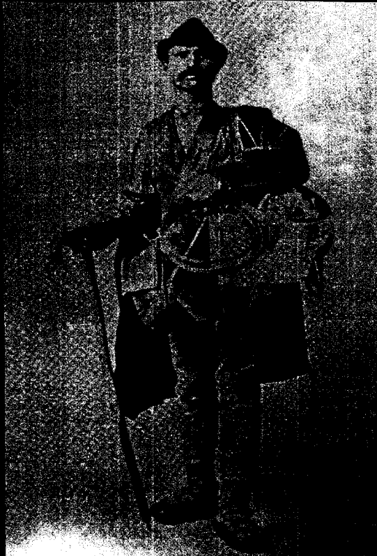
■ obrázek 18 Vandrovní dráteník z počátku 20. stol. (Považské múzeum v Žilině)