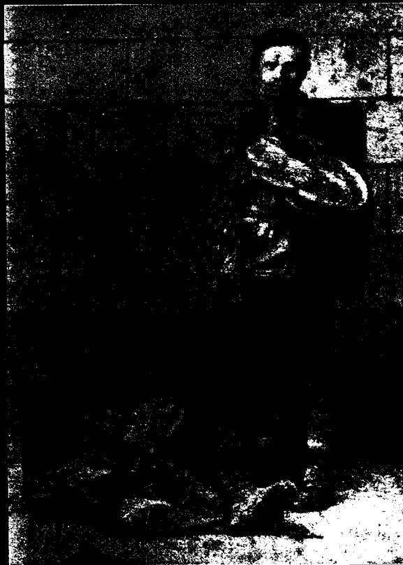
■ obrázek 12 Dráteníci na fotografii z konce 19. stol.