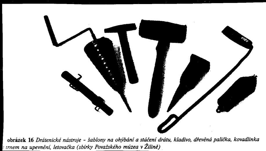
☞ obrázek 16 Dráténické nástroje - šablony na ohýbání a stáčení drátu, kladivo, dřevěná palička, kovadlinka : trnem na upevnění, letovačka (sbírky Považského múzea v Žilíně)