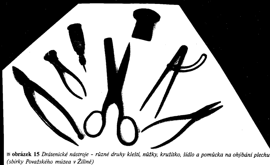
☞ obrázek 15 Dráténické nástroje - různé druhy kleští, nůžky, kružítko, šídlo a pomůcka na ohýbání plechu (sbírky Považského múzea v Žilíně)