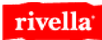
obr. 5 Rivella AG

Hlavním a největším sponzorem švýcarského florbalu je nápoj Rivella AG. Orion Rechtsschutz (právní ochrana) je sponzorem nejlepších střelců v NLA. Vybavení pro národní tým zajišťují Adidas a florbalová firma Interhockey/Canadien a pro rozhodčí firma Athleticum. Dalšími partnery jsou Gast Reisen (cestování), Pringles (chipsy), Concordia (pojištění), Rugenbräu (pivo), mobilezone (telekomunikace), Perskindol (léky) a Wittwer Druck (tiskárna).