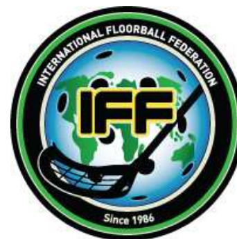
obr. 3 Logo IFF

Florbal se však dostával do povědomí ve stále více zemích a to byl motiv pro vytvoření zastřešující florbalové organizace, která bude brát pod svá křídla národní florbalové svazy. Mezinárodní florbalová federace (IFF) byla založena v roce 1986 ve švédské Huskvarně a u zrodu byli největší propagátoři florbalu v Evropě – Švédsko, Finsko a Švýcarsko. Mezi členské země se postupně zařadili v roce 1991 Dánsko a Norsko, v roce 1992 Maďarsko a v roce 1993 společně s Ruskem také Česká republika. Dnes má IFF již 32 členů.