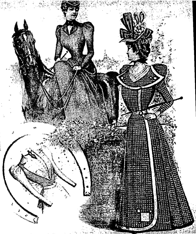
Elegantní, ale stále nepohodlné Ještě na konci 19. století usedaly dámy do sedla v dlouhých sukních.

Žena roku 1900 měla v šatníku kostýmy pro nejrůznější příležitosti – například i pro jízdu na kolečkových bruslích. (Plakát Antonína Brunnera z roku 1900)