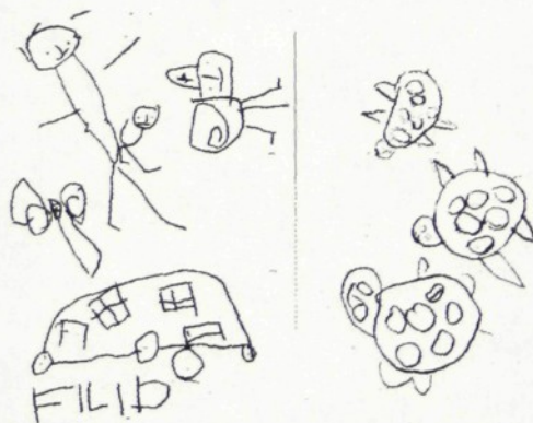
kresba čtyřletého chlapce

Kresba dítěte na začátku tohoto období je charakteristická především svislými čarami a kruhy. Rozvíjením jemné motoriky a fantazie se postupně dítě pouští do složitějších kreseb. Obrázky obsahují množství detailů. Dítě stejně jako do hry vnáší i do kresby své vnitřní pocity a představy.