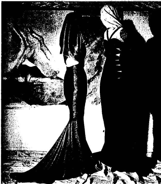
Azzedine Alaia navrhl šaty v siluete přesýpacích hodin v roce 1985. Tehdy se pozornost upínala k dokonale pěstěnému tělu. Azzedine usiloval o jeho zviditelnění. Používal záševků, šikmých střihů a průstřihů, pracoval s elastickými materiály a kůží.